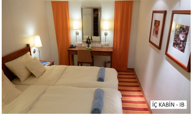
İÇ KABİN - IB