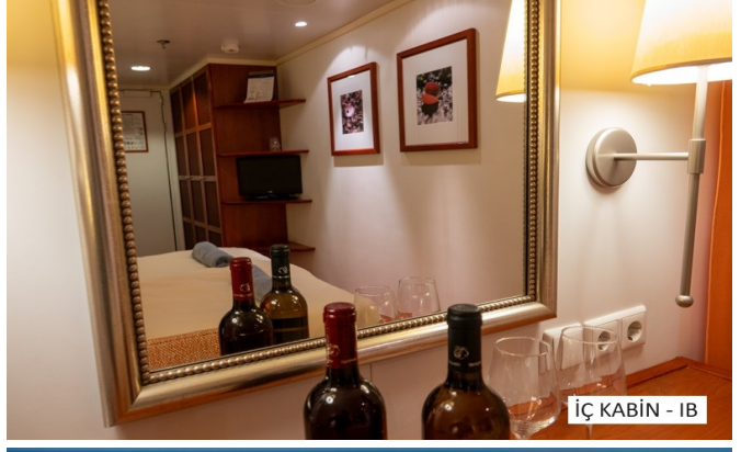
İÇ KABİN - IB