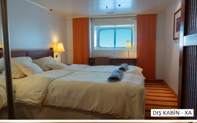
DIŞ KABİN - XA