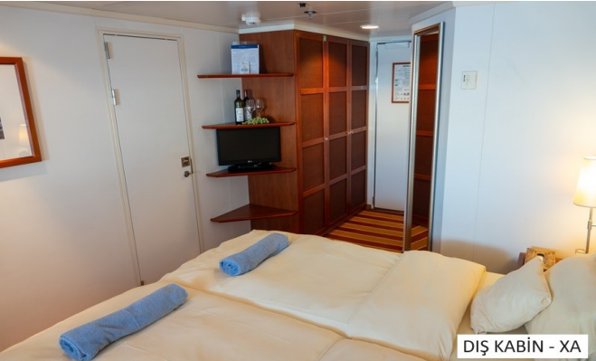
DIŞ KABİN - XA