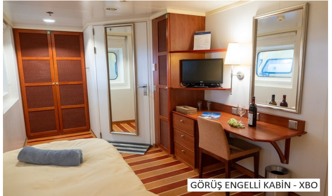
GÖRÜŞ ENGELLİ KABİN - XBO