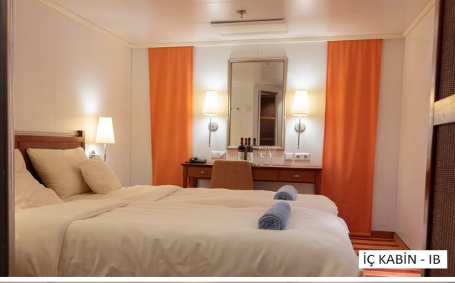
İÇ KABİN - IB