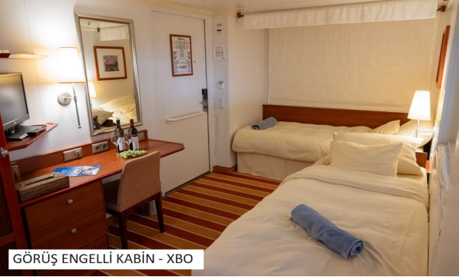
GÖRÜŞ ENGELLİ KABIN - XBO