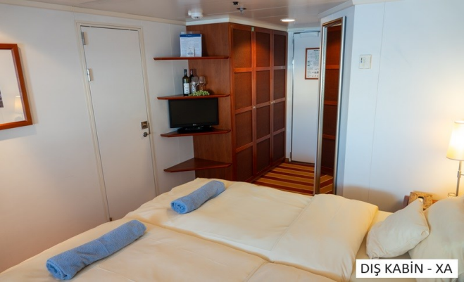
DİŞ KABIN - XA