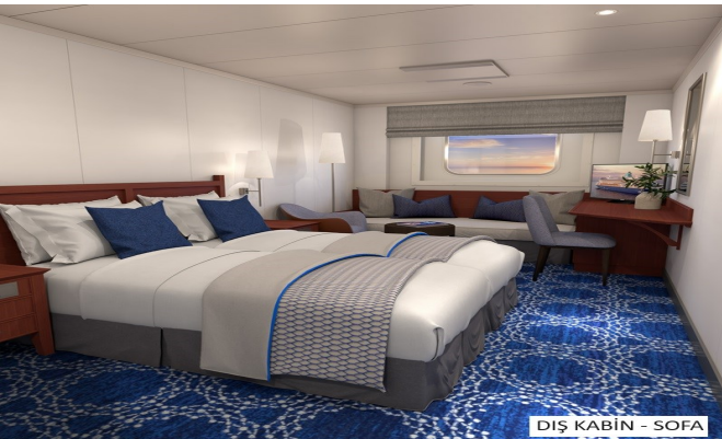
DİŞ KABIN - SOFA