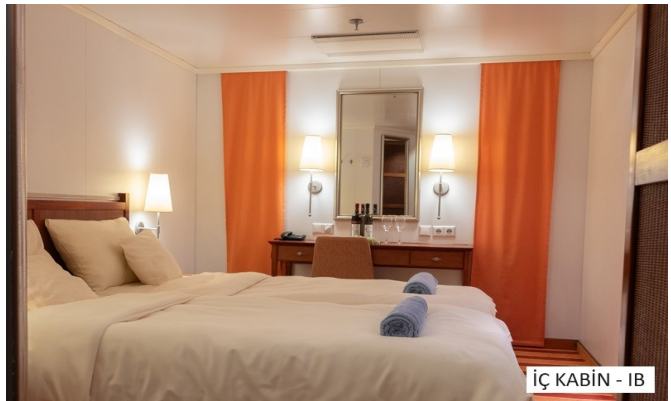
İÇ KABIN - IB