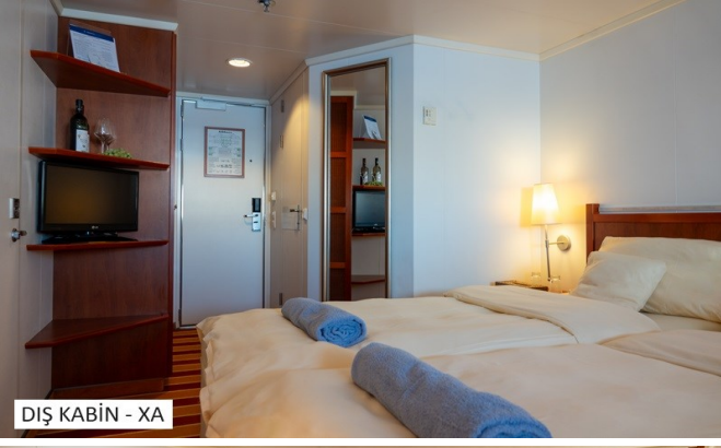
DİŞ KABIN - XA