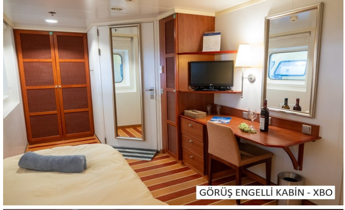
GÖRÜŞ ENGELLİ KABIN - XBO