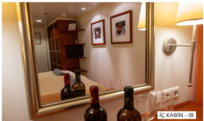
İÇ KABIN - IB