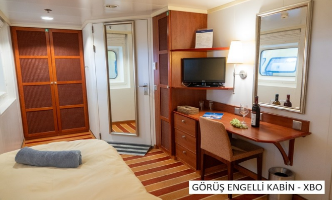
GÖRÜŞ ENGELLİ KABİN - XBO

https://yurtdisitatilim.com/celestial-iconic-aegean-yunan-adalari-atina-turu-yaz-dönemi-2458