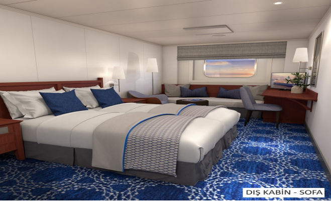
DIŞ KABİN - SOFA