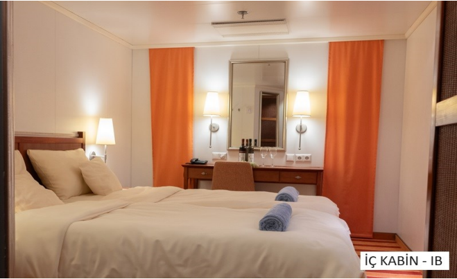
İÇ KABİN - IB