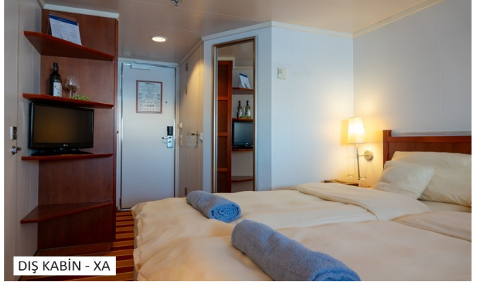
DIŞ KABİN - XA