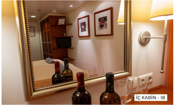
İÇ KABİN - IB