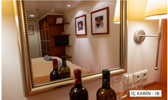
İÇ KABİN - IB