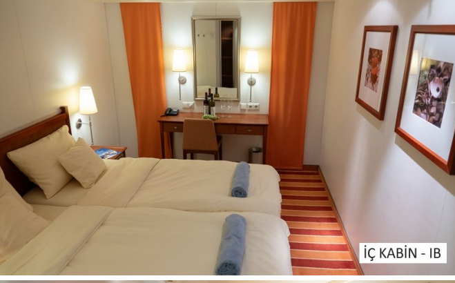
İÇ KABİN - IB