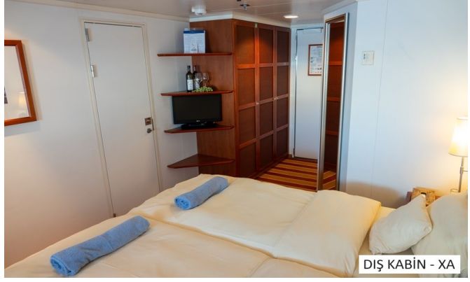
DIŞ KABİN - XA