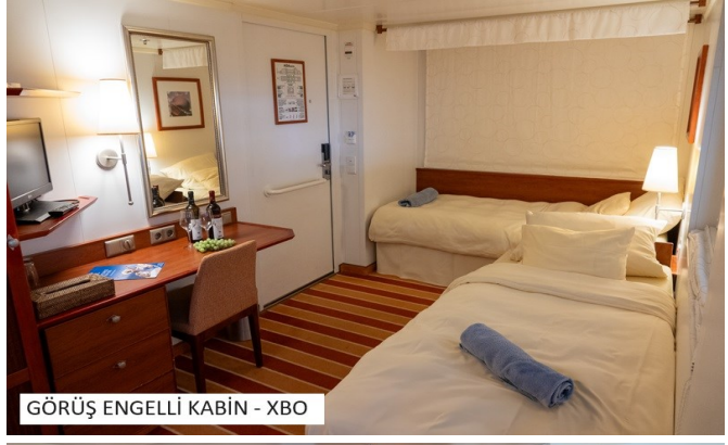
GÖRÜŐ ENGLLİ KABİN - XBO